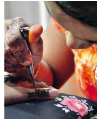
Die bunte Mischung aus Chinesen, Malaien, Indern und einer Vielzahl weiterer Ethnien verleiht Singapur einen unnachahmlichen Charme. Die kulturelle Vielfalt wird als großartiger Reichtum des Staates gefeiert.