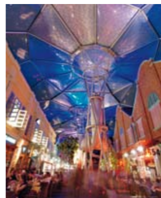
Der Singapore River schlängelt sich auf einer Länge von 3,2 km durch die Innenstadt. Einst war seine Mündung der erste Hafen Singapurs und somit das Herzstück aller Geschäfte. Hier trafen sich Händler und Kaufleute, um den Grundstein für Singapurs legendären Aufstieg zu legen.