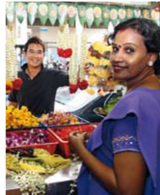
Das Straßenleben in Little India ist bis heute besonders bunt und vielfältig. In winzigen Läden, sogenannten „5-Foot-Ways“, wartet ein einzigartiges Warenangebot auf seine Käufer. Leuchtende Blüten und duftende Gewürze verschaffen dem Straßenbild ein ganz besonderes Ambiente.

Wer nun so langsam hungrig geworden ist, dem bieten sich in Little India alle erdenklichen Möglichkeiten. In den Restaurants entlang der Race Course Road erschließt sich die ganze kulinarische Vielfalt Indiens. So kredenzt das alteingesessene Banana Leaf Apollo vegetarische Gerichte und herrliche Seafood-Spezialitäten, während das angesagte Mustard köstliche Spezialitäten aus dem Punjab und Bengalen aufischt.