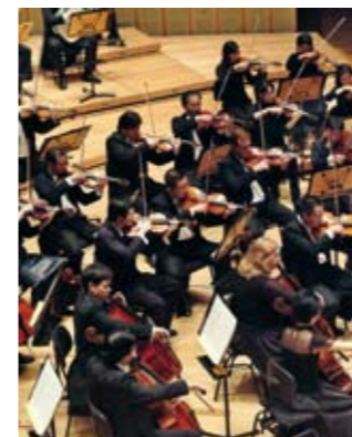
Die Singapurer Symphoniker genießen weit über die Landesgrenzen hinaus einen hervorragenden Ruf und gelten als eines der besten Orchester Asiens. Musiker aus mehr als 17 Nationen sind heute Teil des Ensembles und sehen sich selbst als kulturelle Brücke zwischen Asien und Europa.