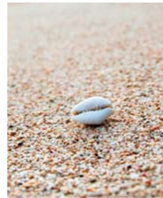
Kilometerlange Sandstrände, abgelegene, kleine Buchten oder die tiefschwarzen Lavastrände im Norden der Insel – Balis Küstenlinie ist die perfekte Ergänzung zu den kulturellen Schätzen des Landesinneren. Ob beim Wellenreiten in Jembrana oder bei einem ausgedehnten Strandspaziergang in Legian, Bali lässt die Herzen aller Strandliebhaber höher schlagen.

Mit einem unschlagbar guten Preis-Leistungs-Verhältnis und einer großen Auswahl an Unterkünften – von einfachen Strandbungalows bis zu edlen Resorts – steht der tropische Inseltraum Bali einem jeden Reisenden offen.