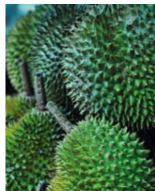
Wer einmal im Leben in den Genuss des jährlich stattfindenden Food Festivals kam, beginnt zu erlernen, welchen zentralen Stellenwert das Thema Essen in der Kultur Singapurs hat. Picknicks, Themenabende, Dinners – hier sind den kulinarischen Genüssen keine Grenzen gesetzt.

Und so bleibt am Ende eines Streifzugs durch Asiens Schlaraffenland nur der Rat „Man man chi“: „Langsam essen!“, das chinesische Pendant zu „Guten Appetit“.