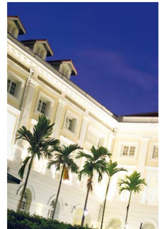
Noch heute entführt ein Besuch des Raffles Hotels in längst vergangenen geglaubte Zeiten.

1963 sagten sich Singapur mit Malaysia jedoch von der Krone los und wurden unabhängig. Doch bereits am 9. August 1965 verließ Singapur die Föderation, um fortan als eigenständiger Staat zu existieren. Unter der Leitung des Premierministers Lee Kwan Yew entwickelte sich Singapur in rasantem Tempo zum Multikulti-Staat und Wirtschaftswunder par excellence. So ist Singapur heute der größte Handelshafen der Welt und seine Einwohner genießen einen sehr hohen Lebensstandard sowie hervorragende Bildungsmöglichkeiten.