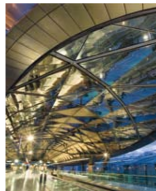
Längst ist Singapur einer der renommiertesten und beliebtesten Tagungsorte Asiens. Professionalität, perfekter Service und neueste Technologie garantieren einen reibungslosen Ablauf jeder Veranstaltung und die vielfältigen Freizeitmöglichkeiten dazu den perfekten Rahmen.

Doch nicht nur Kreuzfahrttouristen sind von der Löwenstadt begeistert, sondern auch die Teilnehmer von Messen, Ausstellungen und Konferenzen. Sie machen etwa ein Drittel aller Singapur-Besucher aus. Als Sitz von über 7.000 internationalen Unternehmen bietet der Stadtstaat perfekte Rahmenbedingungen für die Geschäftswelt. Zudem ist mit dem gewaltigen kulturellen und kulinarischen Angebot für viel Abwechslung gesorgt, ganz zu schweigen von den unzähligen Shopping-Möglichkeiten. Vor allem das Singapore Expo Centre mit seinen zehn Hallen eignet sich dank seiner exzellenten Verbindungen zum Flughafen und dem Stadtzentrum hervorragend für internationale Ausstellungen und Konferenzen. Aber auch andernorts erweist sich Singapur als perfekter Veranstaltungsort: Ob eine Konferenz im Suntec City, ein Business-Meeting im Conrad Centennial Hotel oder ein Incentive im Resorts World Sentosa – den Möglichkeiten sind kaum Grenzen gesetzt.