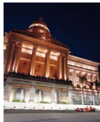
Der große Preis von Singapur und sein spektakuläres Nachtrennen durch die Innenstadt hat sich in nur 3 Jahren zu einem absoluten Highlight der Formel 1 entwickelt. 1485 Scheinwerfer sorgen dafür, dass dem Besucher nichts entgeht, wenn die Fahrer durch den knapp 5 km langen Rennparcours brausen.

Doch auch Weltliches bewegt die Stadt: Einmal im Jahr verfällt ganz Singapur dem Geschwindigkeitsrausch der Formel 1, begibt sich kollektiv während des Great Singapore Sales auf Schnäppchenjagd oder genießt die Gaumenfreuden des World Gourmet Summit und des Food Festivals. Darüber hinaus locken zahlreiche Kunst- und Musik-Veranstaltungen. Hier findet ein jeder eine Veranstaltung nach seinem Geschmack.