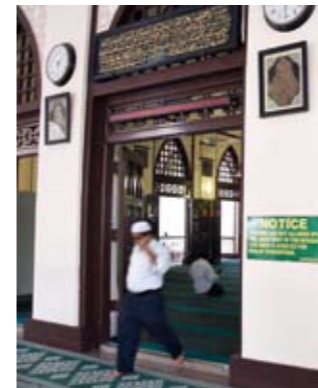
Bis heute schlägt im Kampong Glam das Herz der malaiischen Bevölkerung des Stadtstaates. Am Ende der muslimischen Fastenzeit wird das Viertel für das Hari Raya Lichterfest liebevoll mit unzähligen Lämpchen dekoriert. Überall wird ausgelassen gefeiert und gegessen.

Im „Dorf des Kajeputbaums“ lebten muslimische Malaien lange vor Ankunft der Briten. Noch heute kann man bei jedem Schritt und Tritt Geschichte atmen.